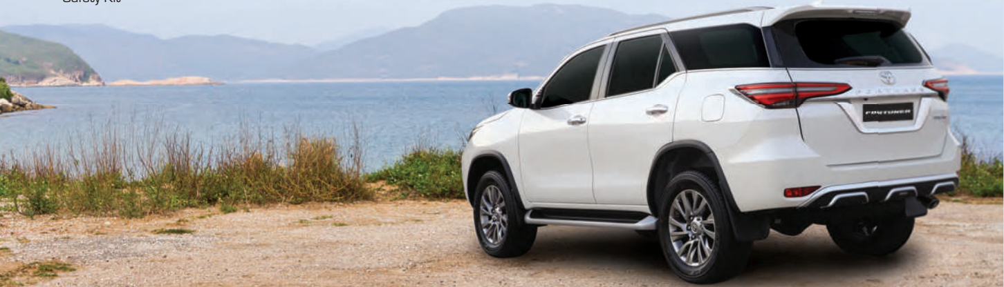
* Dealer installed items. Safety kit includes fire extinguisher, warning triangle, tyre pressure gauge & first aid kit. Specifications of vehicle imported from Toyota Motor Corporation are as per the GSD Conformity Certificate applicable to the model/grade. Parameters such as vehicle weight, dimensions & fuel economy; could vary from the SSD Conformity Certificate due to fitment of dealer installed accessories. Pictures and colours in this catalogue may differ from actual specifications. All model grade descriptions are grade names given by Saud Bahwan Automotive and are meant for differentiation purpose only, For further details & to ascertain availability of stocks, please visit your nearest Toyota Showroom.